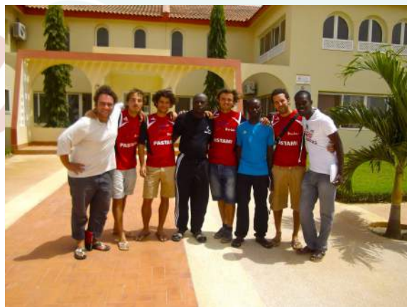
Des ostéopathes à Saly - projet Sénégal 2015